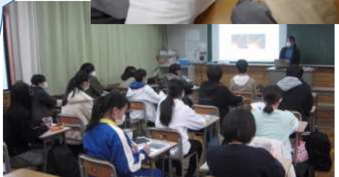
大学院生からの研究発表↑