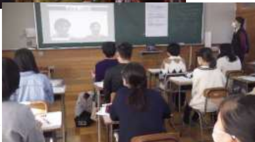
リモート 模擬授業→

大学の先生方から探究課題をいただいて、各班ごとに取り組んできた探究学習。 11月12日(木)・18日(水) には同じ課題に取り組んだ班同士が集まって、成果を発表しあいました。また 11月19日(木) にはzoomで各大学の先生と飯田高校をつなぎ、事前に見ていただいた生徒の発表へのご講評と、大学の模擬授業をしていただきました。大学進学を目指す生徒にとってとても貴重な機会となりました。