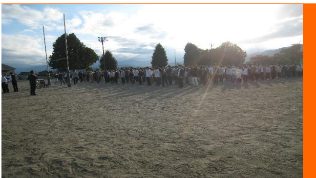
全校生徒がグラウンドに避難！