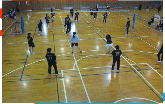
バレーの試合風景

また、休校からのスタートで「クラス」でまとまるきっかけが非常に少なかった1年生にとっても、授業とは違う友達の新たな一面の発見につながったことと思います。