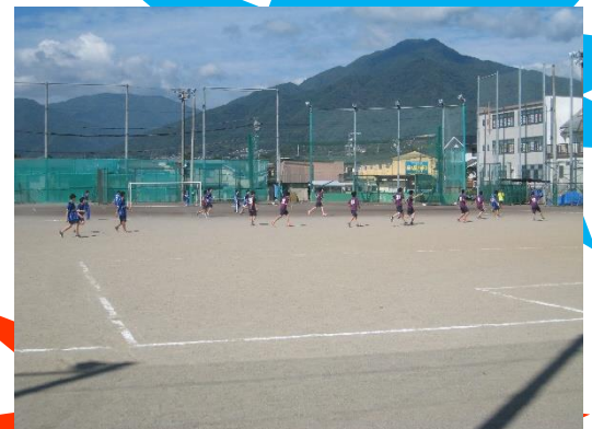
サッカーの試合風景

感染症対策の制約や台風の影響による2日目の延期により、競技時間の大幅変更などのアクシデントに見舞われましたが、大盛り上がりの中終わることができました。