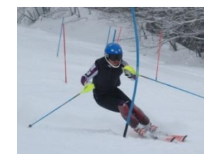
高校総体県大会 GSL6位 国体予選少年男子 GSL3位