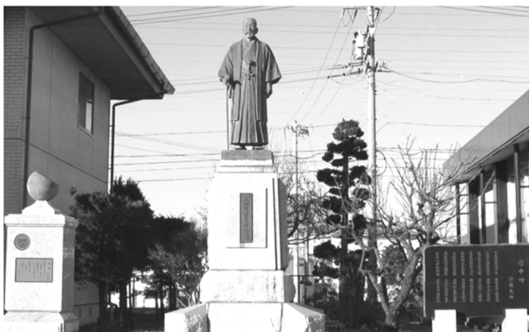
岩村田中学校初代校長