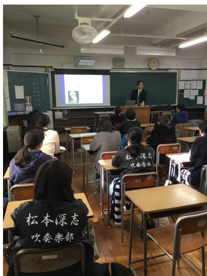
フィールドワークの魅力について

深志 40 回の皆さんの卒業 30 周年記念事業の一環で、2 年生対象の特別講義を土曜日の 3 時限に行っていただきました。10 月に深志 20 回の皆さんによる 1 年生対象の特別講義がありましたが、その第 2 弾です。皆さん 40 代後半、まさに脂が乗りきっている年代で、様々な分野の第一線で活躍されている体験談を直接お聞きできる貴重な機会となりました。