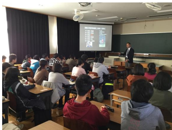
「3Dプリンターで神経を再生する」

また、母校援助として財政的にもご支援をいただき、本当にありがたい限りです。この場をお借りして厚くお礼申し上げます。 10 名の方々に、医学（再生医療、内科医）・理工（ソフトウェア開発、コンピュータ、弁理士、自動車開発、応用生物学）・経済（不動産）・文学（出版）・地域研究・公認会計士・弁護士の分野に渡って講義をしていただきました。いつも書くことですが、卒業生の活躍されている分野は多岐に渡っていて、深志の底力、多様性、層の厚さというものを実感します。