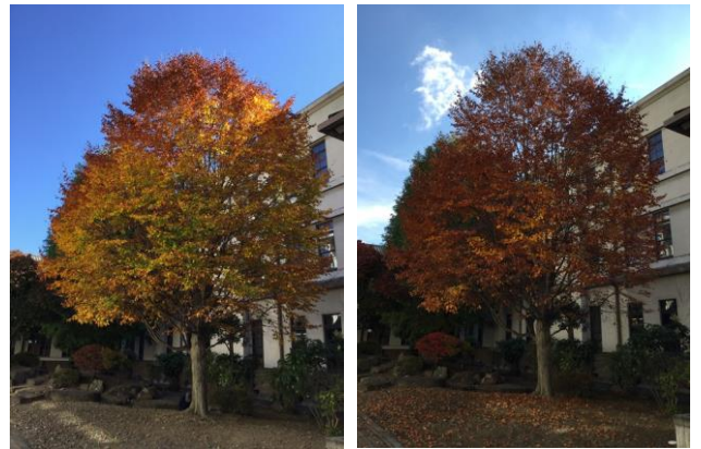
中庭の紅葉 左：11/1 右：11/7 落ち葉掃除が大変です

先々週は 2 年生がキャリア研修、3 年生は実力テストのため、1 年生のみ通常授業でした。そして先週は、1・2 年生が期末考査に突入り 3 年生のみ通常授業。このように学年ごとに日課が異なる場合、チャイムをどうするかが問題になりますが、先々週は ノーチャイム 、そして先週は考査に合わせて鳴らす、ということで特に混乱もなく一日が進行しました。こういった日は時々出現するので生徒も先生も慣れている、ということもあるのでしょう。学校にチャイムは必須のものと思いがちですが、全国的に見るとチャイムを鳴らさない学校が全体の 1 割程度ある、との調査もあります。これは、時計を見て行動することで自主性を育てる、というもっともな理由の他に、近所の方々からの音へのクレームが多い、という事情もあったりするようです。個人的には時間と気持ちと行動にメリハリをつけるためにチャイムが鳴った方が良くように思いますが、いろいろな考え方や難しい状況に置かれている学校もあるんですね。立冬が過ぎて校内の紅葉も終盤、 大学入試センター試験まで残り 2 ヶ月余り となりました。