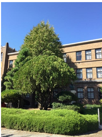
9月28日、久しぶりの青空広がる

★ 去る9月8日に松本市勤労者福祉センターで行われた「保護者教職員のつどい」で、本校ダブルダッチ部がパフォーマンスを披露しましたが、そのお礼の便りをいただきました。寄せられた感想には「新鮮で感動しました。生徒たちの表情が生き生きと明るく、見ている側も楽しくなりました。」「生徒自らが考えて活動している様子が想像できる発表で、楽しく見ることができました。」など、好評だったことが充分にうかがえる内容の文章が並んでいました。ダブルダッチ部は10月7日のSBC「夢テレビ2018」や10月13日の定時制通信制生徒生活体験発表大会（松本市Mウィング）にもゲストとして出演予定です。