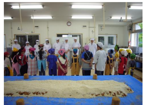
◎みそ作り体験、高校生が小学生に説明