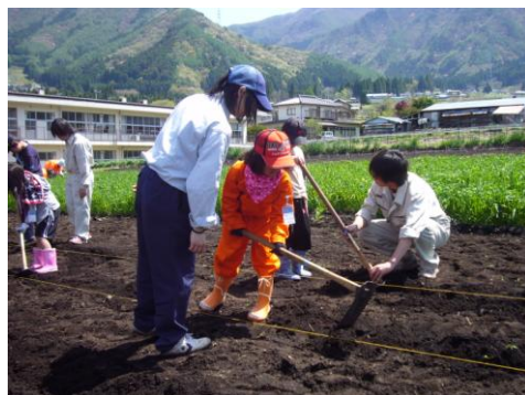
◎小学生に鍬の使い方を教える生徒

小学生、大学生そして 農家先生（大人の方々） と、世代を越えて交流す る中から、多くのことを 学んでいます。