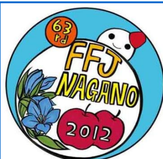
大会シンボルマーク

長野県内の12校で学ぶ農業クラブ員、総勢3,000余名が協力して準備し、約5,500名が参加する全国大会を運営します。