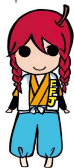
大会キャラクター“あかねちゃん”