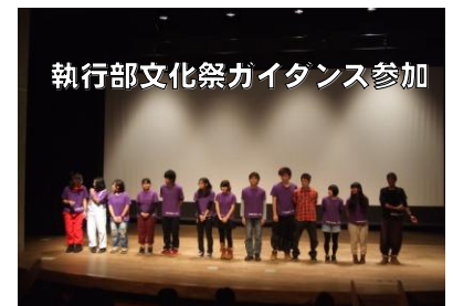
執行部文化祭ガイダンス参加

執行部が「文化祭ガイダンス」で発表しました 11月13日(日)波田アクトホール(松本市波田文化センター)「開祭式の作り方」をテーマに、質疑応答を含め、約90分間の実践発表をおこないました。