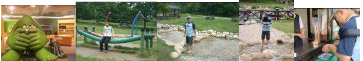
でいらくんと一緒に！

お弁当を注文したお昼では、公園の真ん中のシートでみんなでおいしくいただきました。選び抜いたこだわりの味、みんなもりもりいただきました。選び抜いたといえば、おやつのお買い物もそう。まきば山荘のおやつショップで一人ひとり頼んで買い物ができました。お金のやりとりや店員さんへお礼も言えて、とてもいい体験だったなと思います。満足そうな表情の子どもたちでした。