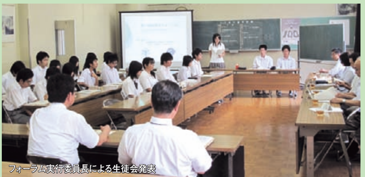
フォーラム実行委員長による生徒会発表