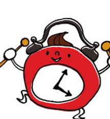
タイム あんまり目立たないが優等生タイプ(?)