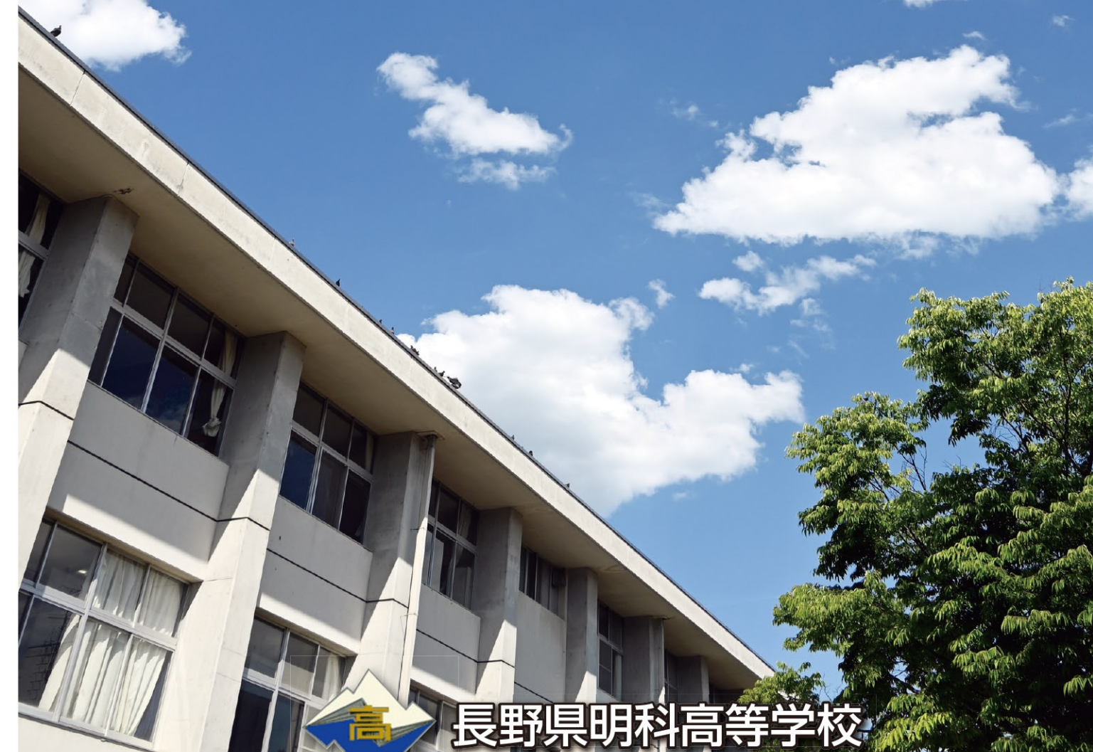
長野県明科高等学校