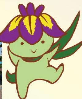
リーリオちゃん あやめ祭り公式キャラクター (本校生徒デザイン)