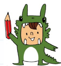
あっか 活発に動き、一番(熱心)に問題に取り組む。