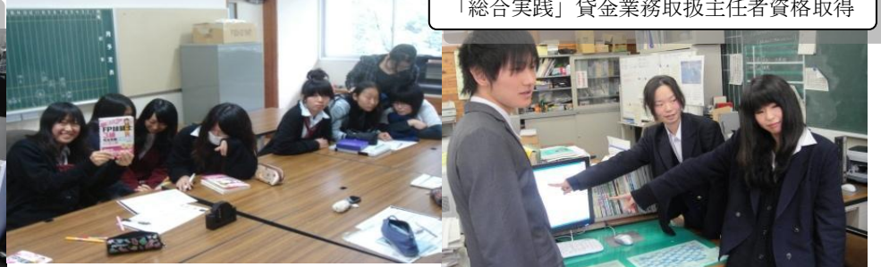
「総合実践」企業年金総合プランナー資格取得