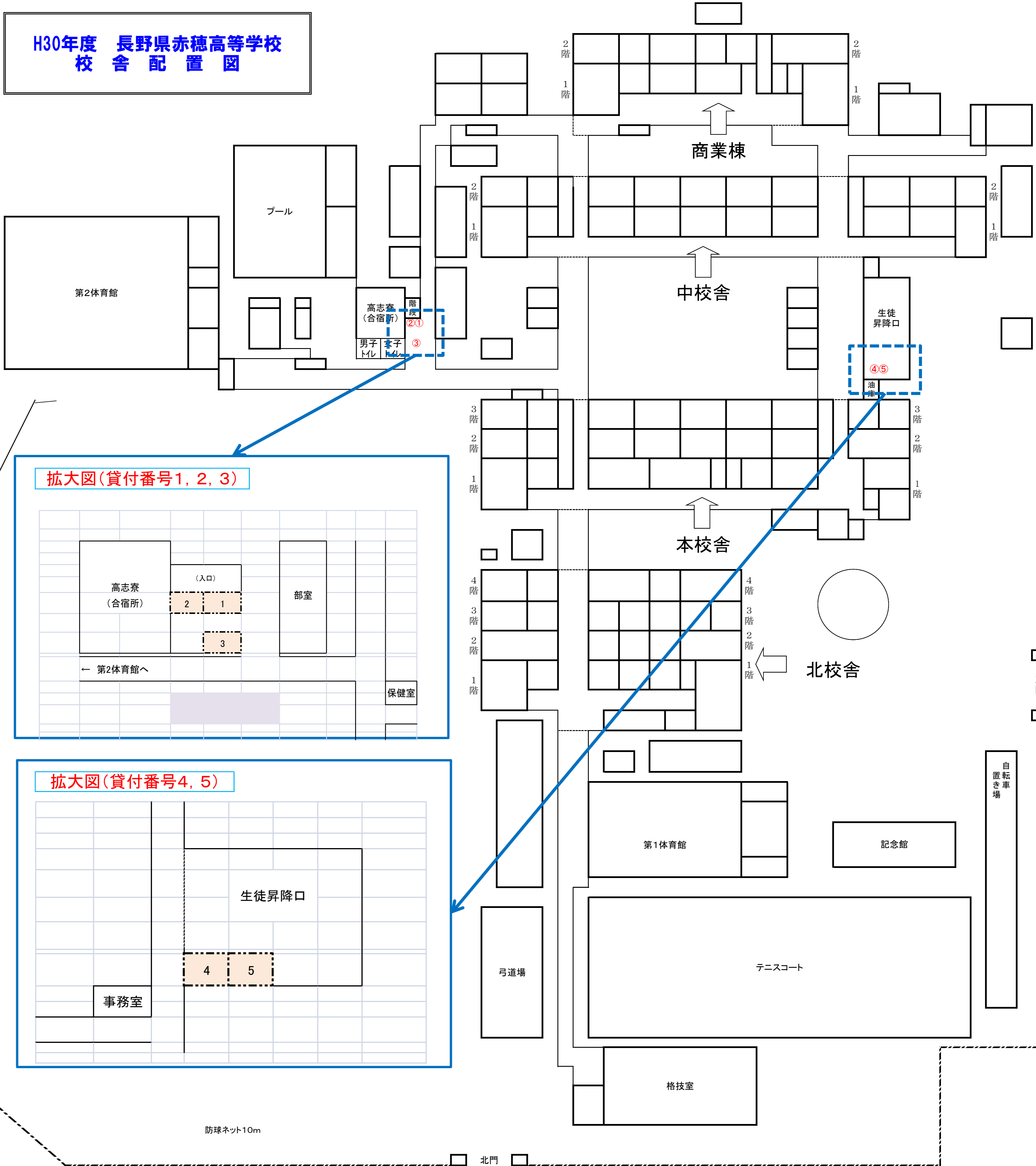
拡大図(貸付番号1, 2, 3)