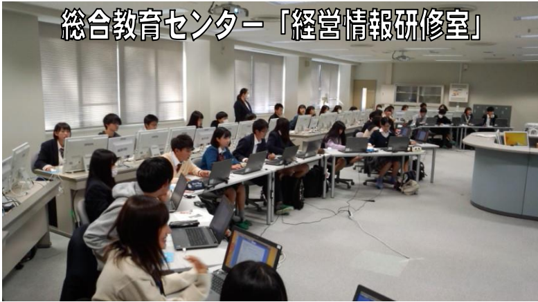
総合教育センター「経営情報研修室」