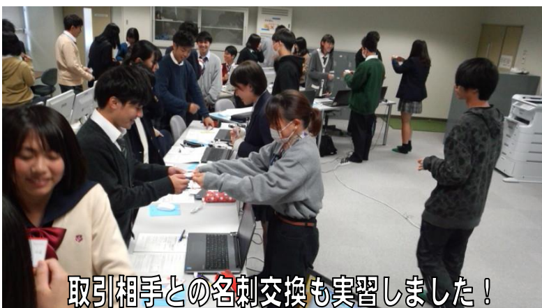
取引相手との名刺交換も実習しました!

商業科3年(A組・B組)は長野県総合教育センター(塩尻市)で、クラスごとに実習を行いました。商業科3年の授業に「総合実践」という科目があり、本校では教室内での模擬商取引を中心に行っています。学校では取引の諸手続きを全て手書きで処理していますが、センターでは導入されている「スーパー実践くん」を利用して、全ての処理をコンピューターで行いました。生徒は商取引の基本の流れを再確認しながら、コンピューター会計の操作と理解を深めました。そして実際の職場(事務等)をイメージしていました。