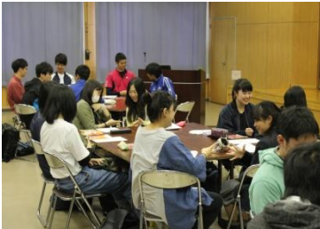
会場に集まった赤穂高生と駒工生と青年会議所の皆さん。