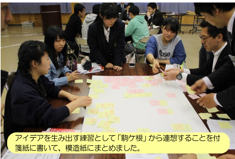
アイデアを生み出す練習として「駒ヶ根」から連想することを付箋紙に書いて、模造紙にまとめました。