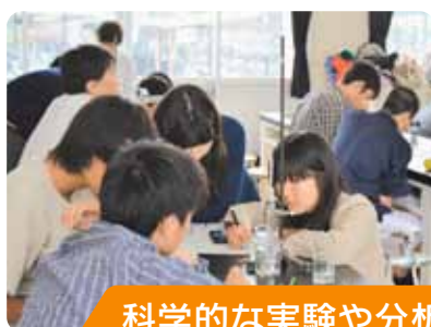
科学的な実験や分析